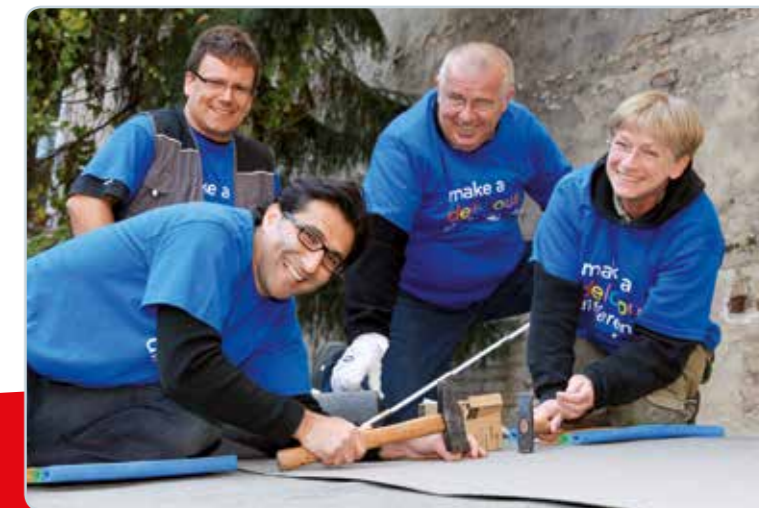
Unternehmensmitarbeiter beim ehrenamtlichen Einsatz

Mehr Informationen und Beispiele finden Sie unter www.caritas-unternehmenskooperationen.de